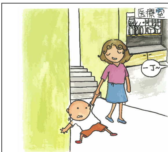
在醫院裏，一丁最討厭打針，一知道要打針，便哭了起來。